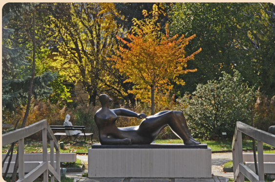
Henry Moore, Reclining Figure, 1982