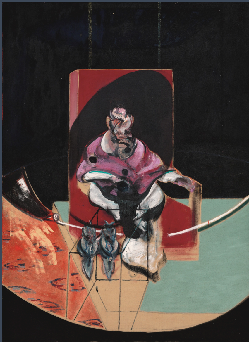
Study for Portrait (with Two Owls), 1963, Huile sur toile, 197.5 x 144.8 cm, San Francisco Museum of Modern Art; Gift of Helen and Charles Schwab in honor of Neal Benezra's leadership and dedication to SFMOMA, © The Estate of Francis Bacon. All rights reserved / 2025, ProLitteris, Zurich

Inspiré par le portrait du pape Innocent X par Velázquez, Bacon plonge dans l'intimité de ses figures, toujours en quête de nouvelles formes. Mais contrairement à beaucoup de ses contemporains, Bacon ne s'est jamais directement confronté à l'original de Velázquez à Rome, ni à celui de Van Gogh, détruit pendant la Seconde Guerre mondiale. Cet éloignement lui offrait la liberté de réimaginer à sa manière ces œuvres, les réinterprétant sans contrainte, avec une vision radicalement nouvelle de la lumière, des couleurs et des formes.