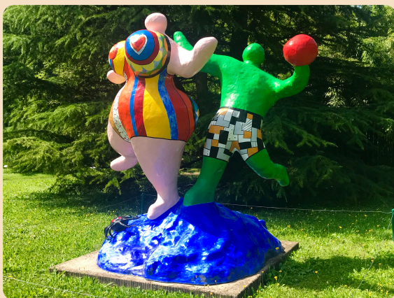
Nikki de Saint-Phalle, Les Baigneurs, 1984