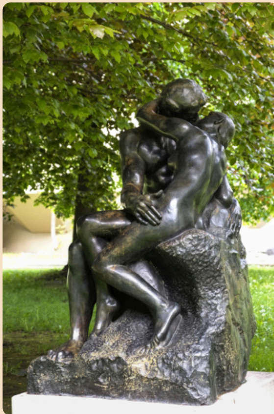
Auguste Rodin, Le Baiser, 1886