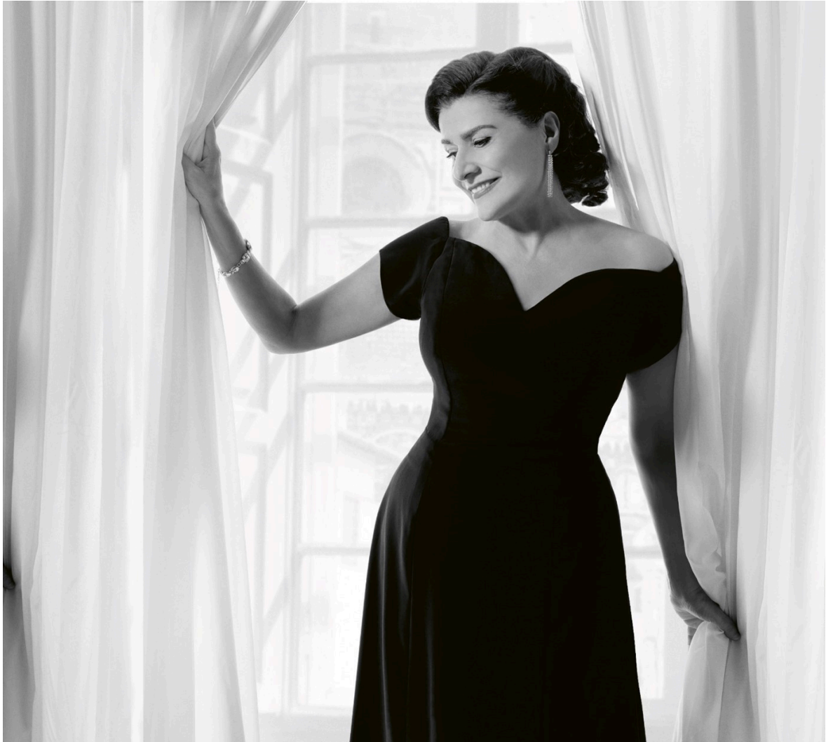
Cecilia Bartoli Mezzo-Soprano