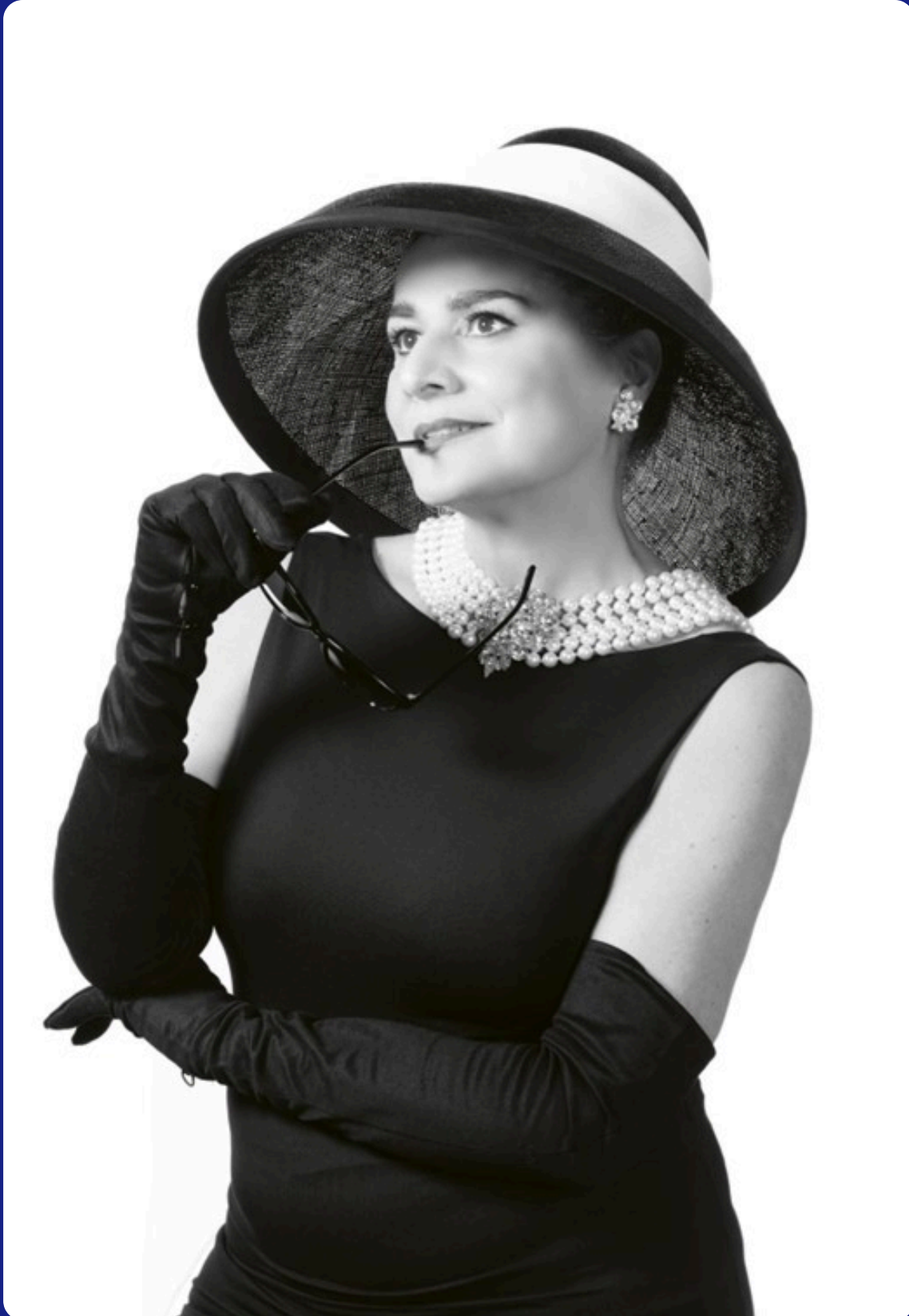
Cecilia Bartoli