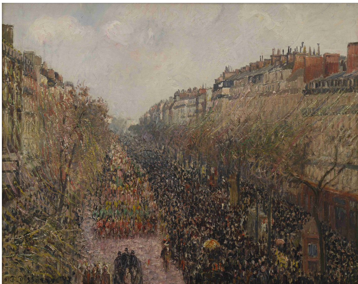
Camille Pissarro (peintre français, 1830-1903), Boulevard Montmartre, Mardi Gras , 1897