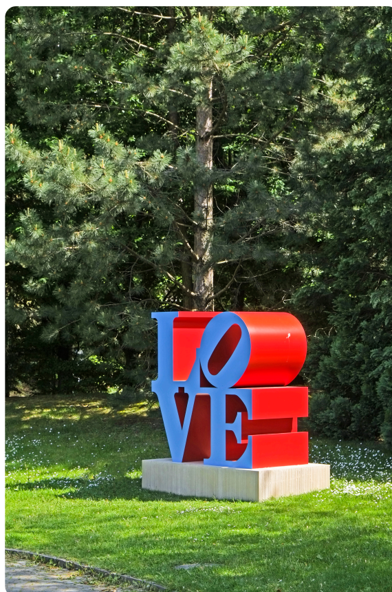
Parc de sculptures : Robert Indiana, Love © Michel Darbellay