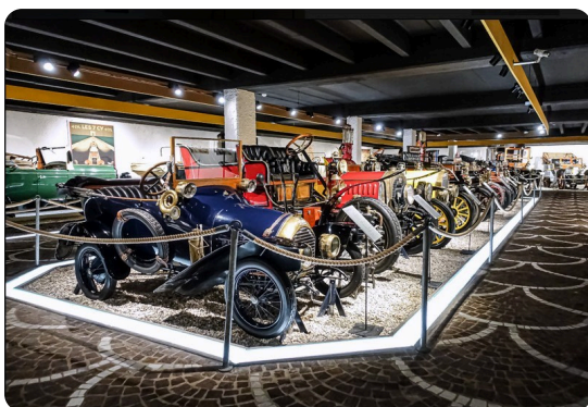
Musée de l'automobile

Léonard Gianadda, Philadelphie, 1953