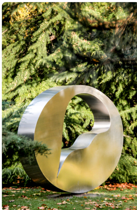
Parc de sculptures : Jean Arp, Roue Oriflamme © Michel Darbellay