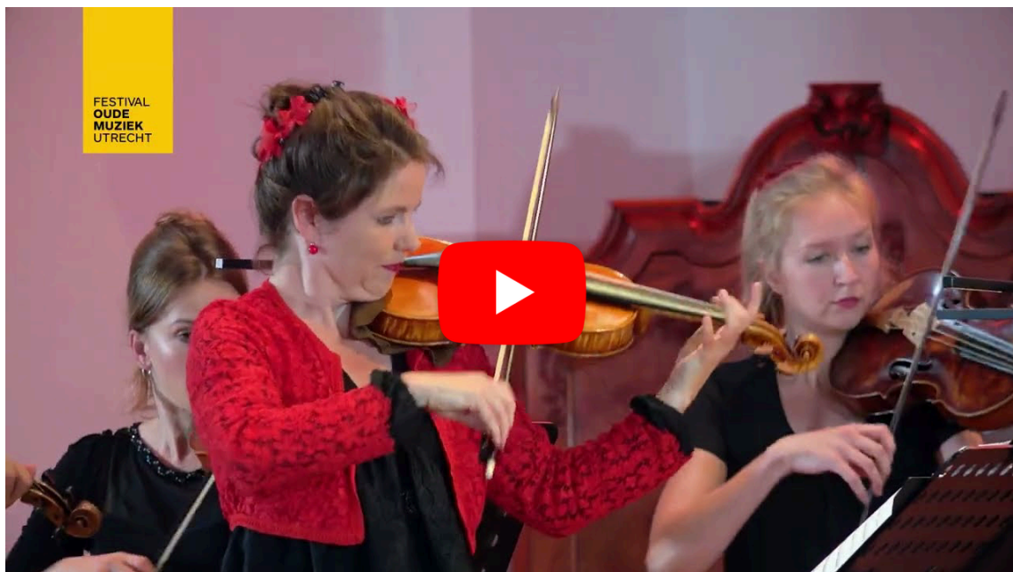
Les Passions de l'Âme - Geminiani La forêt enchantée / Festival Oude Muziek Utrecht