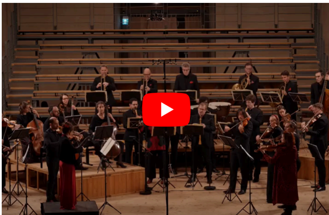
Vidéo Facebook - Les Passions de l'Âme