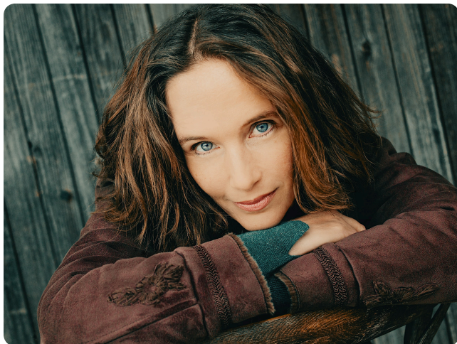
Hélène Grimaud