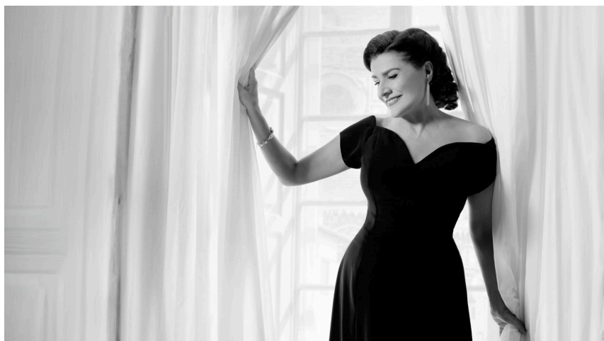
Cecilia Bartoli