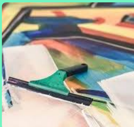
Colore tes émotions