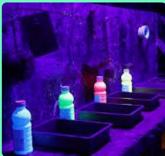
Colore ton fluo

Que vous soyez solo, en couple, en famille, entre amis ou même avec vos collègues, ces box d'expression artistique vous invitent à lâcher prise et à vous éclater avec la peinture.