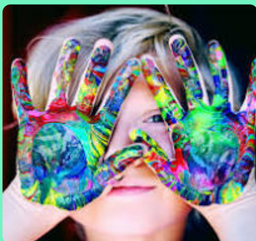
Colore ta famille

... et obtenez 15 % de rabais sur les activités suivantes