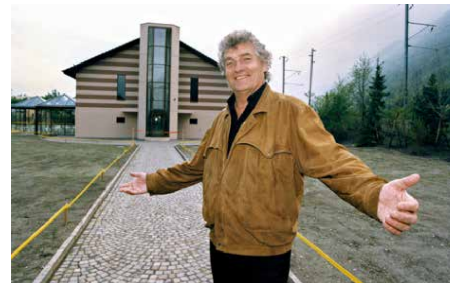
Inauguration du Vieil Arsenal restauré et réaménagé, 1996.